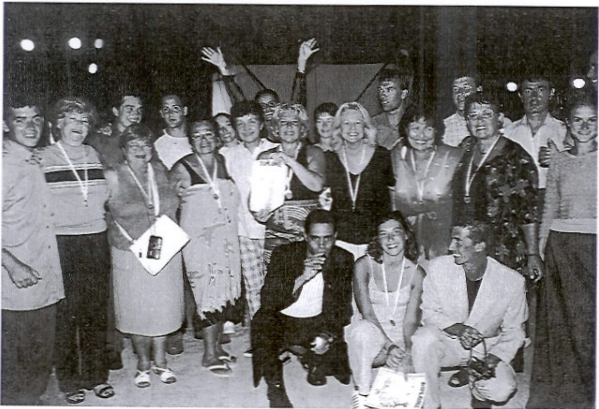
Aux olympiades de la bonne humeur à Beldi, ce sont les membres de l'équipe des "Gazelles" qui ont reçu la médaille et le diplôme