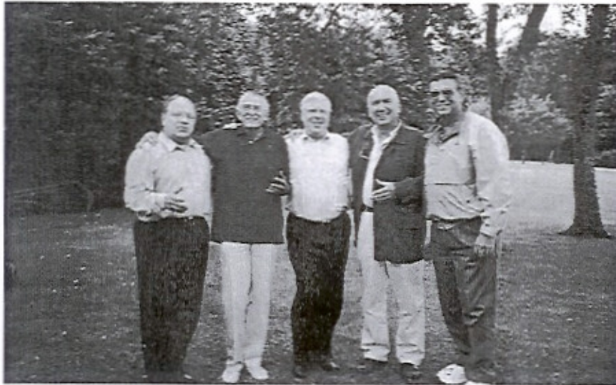
Les "Ghalabaouis" en l'an 2000