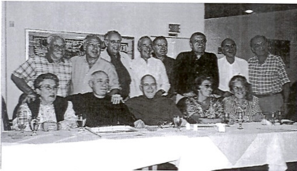
"Chez Daou", le 3 octobre 2000