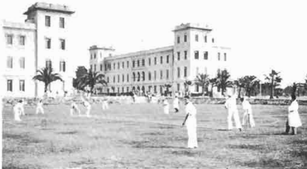
A Pleasure Field - Victoria College - ALEXANDRIA / Egypt.