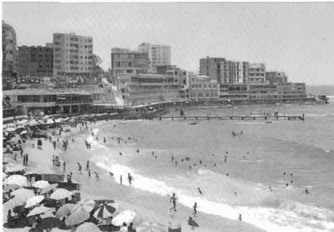
Alexandrie, la plage de Stanley

"Cette ville que j'ai connue, elle est en moi. Je n'ai aucune nostalgie, puisque je l'ai en moi." Georges Haldas