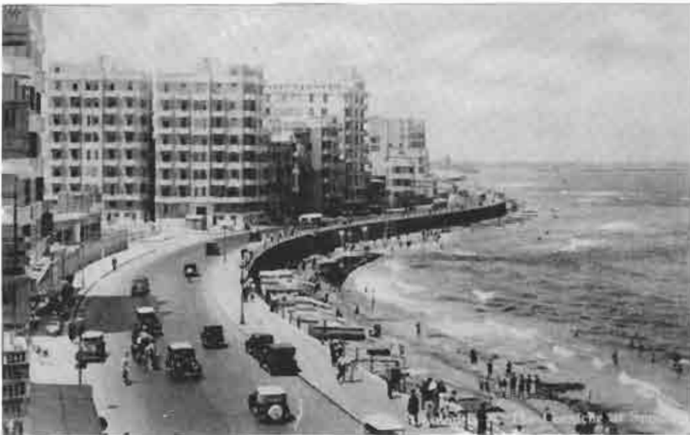
La Corniche à Sporting (photo des années 30)

Tu vis le monde entier, belle cosmopolite, Et plus que ça, tu fus aimée d'Aphrodite, Car la déesse altière, en ton site enchanteur, Ravie, t'offrit tout ce qu'elle avait : son coeur. Séjour des bienheureux, seul paradis sur terre, Fille d'Aphrodite, rien de moins fut ton père Qu'Alexandre le Grand, le vainqueur des Persans. Tu vis Napoléon, le Corse conquérant, Tu ouvris tes grands bras à tous les étrangers, Et en parfait accord tous ces gens mélangés Trouvèrent sur ton sol la nouvelle patrie Qu'ils adorent toujours, ô mon Alexandrie!