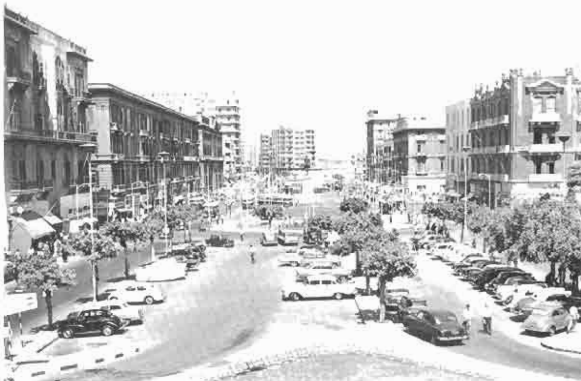
La Place El Tahrir et la Rue El Nasr