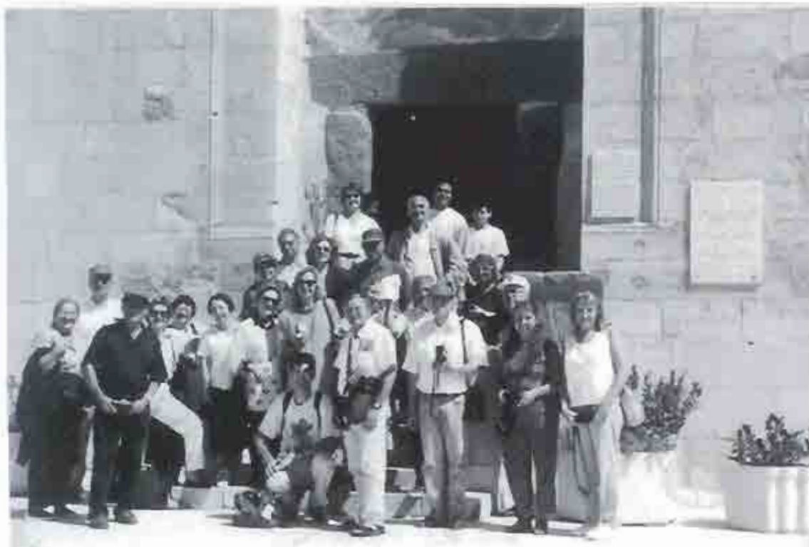
Photo prise devant le Fort Kaït-Bey