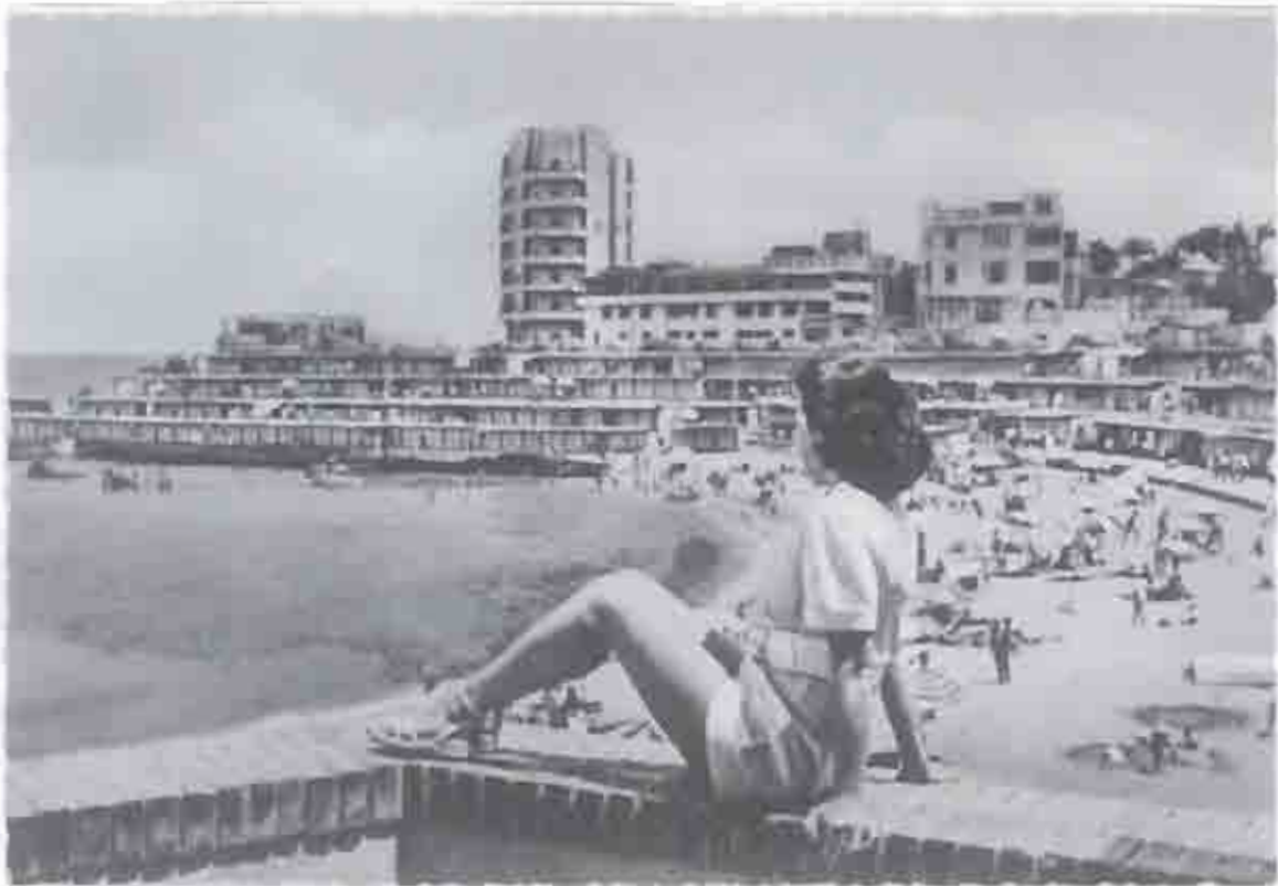
La plage de Stanley