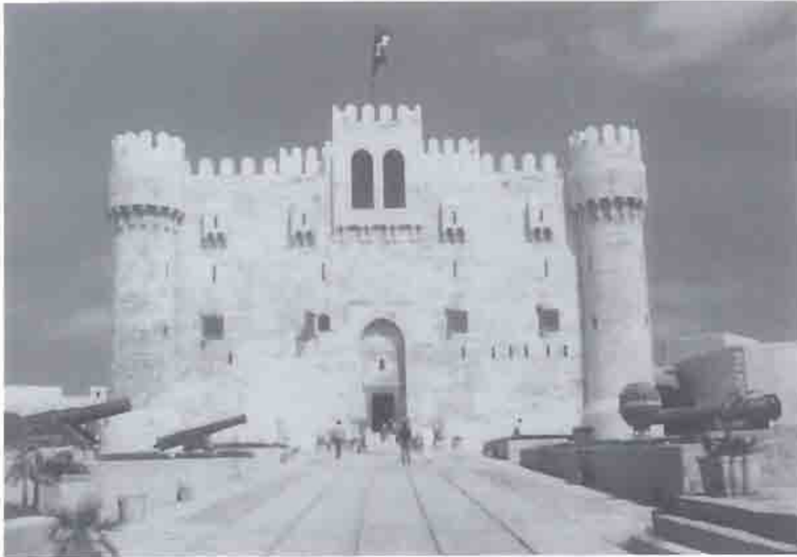
Le Fort Kait-Bey