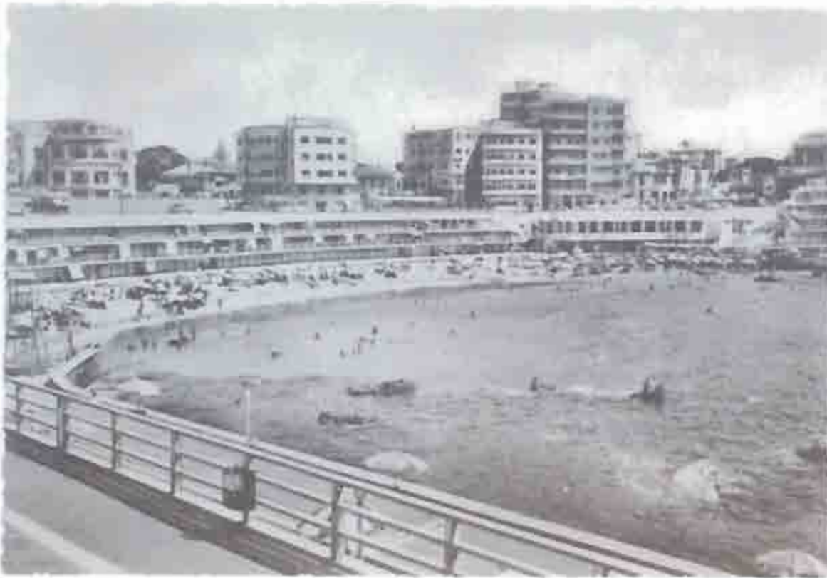
La plage de Stanley