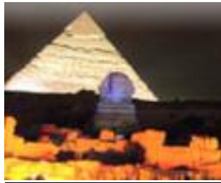
Son et Lumière