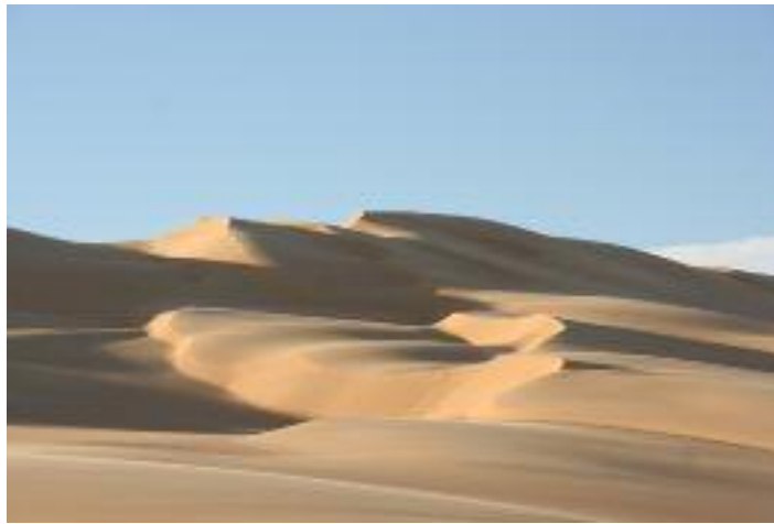
Dunes de sable